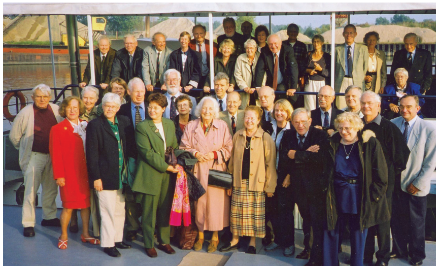
Viering 7 e lustrum op 21 september 2000 te Wijk bij Duurstede.