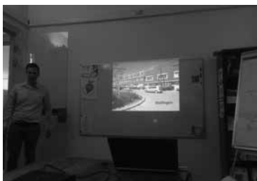
Bedrijfsbezoek bij Companen