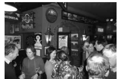
Docenten tijdens Geocafé met pubquiz