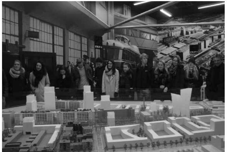
Excursie naar het oud Philipsterrein Strijp-S

Voor meer informatie over de V.U.G.S. en de activiteiten die wij voor onze leden, sponsors, donateurs en alumni organiseren kunt u altijd terecht op