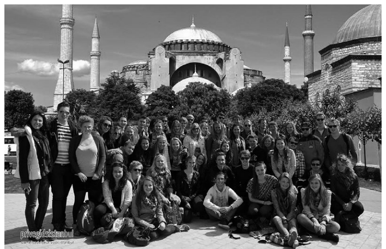
Groepsfoto voor de Hagia Sophia in Istanbul

Tot slot zijn er ook twee reizen georganiseerd. Eind januari zijn 35 V.U.G.S.-ers afgereisd naar Flaine in Frankrijk. Daar hebben ze met elkaar een week lang