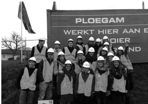
Excursie naar het project 'Ruimte voor de Waal'

op ski's en snowboards genoten van de goede sneeuw en de leuke sfeer. In april werd na maanden van voorbereidingen de buitenlandse excursie naar Turkije georganiseerd. In Turkije heeft een groep van 50 V.U.G.S.-ers Istanbul, Ankara en Cappadocië bewonderd en meer over Turkije geleerd tijdens diverse (stads)wandelingen en lezingen. Zo werd in Ankara een groots seminar georganiseerd met als titel 'The evolution of Ankara from a planning perspective'. Verder is onder andere een bezoek gebracht aan de ambassadeur in Ankara en is een ondergrondse stad in Cappadocië bezocht.