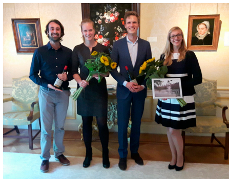
Tijdens de lustrumbijeenkomst van de Hofvijverkring in juni 2019 namen vier jonge onderzoekers hun Hofvijverkring Fellowship in ontvangst.

Met het tweede project – de Hofvijverkring Fellowships – steunt de Hofvijverkring veelbelovende jonge onderzoekers met een beurs van 5.000 euro. Zo krijgen zij de gelegenheid belangrijke internationale congressen te bezoeken of om gedurende twee of drie maanden onderzoek te doen aan een buitenlandse universiteit. Zij kunnen hierdoor van gedachten wisselen met vooraanstaande hoogleraren en andere medewerkers. Dat is belangrijk voor het onderzoek en de persoonlijke ontwikkeling van de jonge Utrechtse onderzoekers. Bij de keuze van de bursalen laat de Hofvijverkring zich leiden door UU-hoogleraren die onderzoeksleider zijn in de focusgebieden van de universiteit. Er wordt onder meer gekeken naar criteria als interdisciplinariteit, wetenschappelijke kwaliteit en maatschappelijke relevantie.