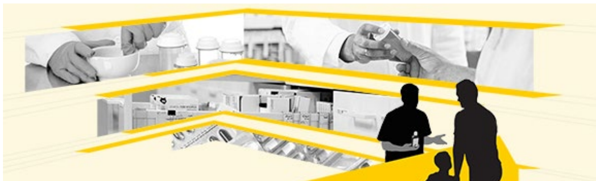
UPPER - onderzoek en onderwijs in de farmaceutische praktijk