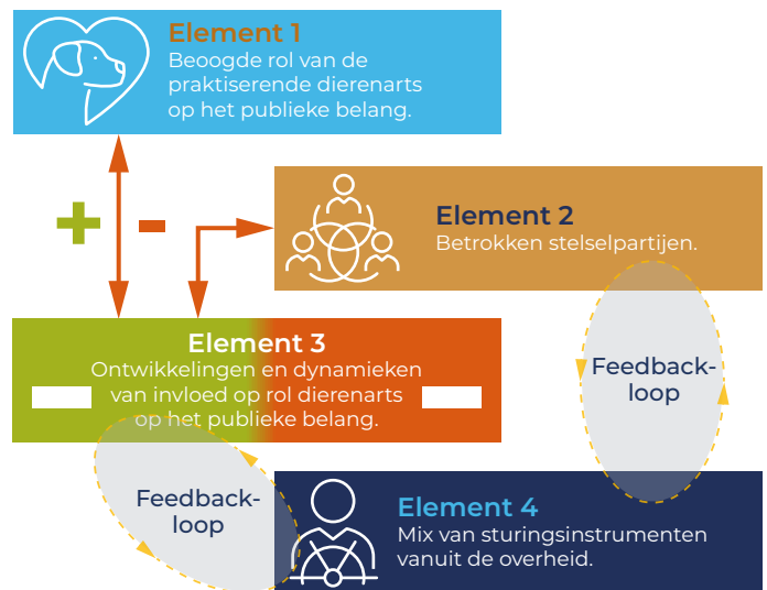
Figuur 4. Analysemodel voor elk publiek belang (diergezondheid, dierenwelzijn, volksgezondheid, voedselveiligheid en milieu).

Daaronder hebben we de uitkomsten beschreven van onze analyse op de rol die van de dierenarts verwacht wordt in relatie tot elk publiek belang. Dit doen we op het niveau van de vier elementen van ons analysemodel. Bij de ontwikkelingen en dynamieken gaat het zowel om die, die wij beschreven hebben in relatie tot het diergeneeskundige veld als om die in de kwaliteitsborging van de diergeneeskundige beroepsuitoefening. Omdat we deze ontwikkelingen eerder in dit rapport al uitgebreid beschreven hebben, beperken we ons hier tot een korte beschrijvingen ervan en of de invloed ervan volgens ons positief of negatief is op de roluitoefening van de dierenarts.