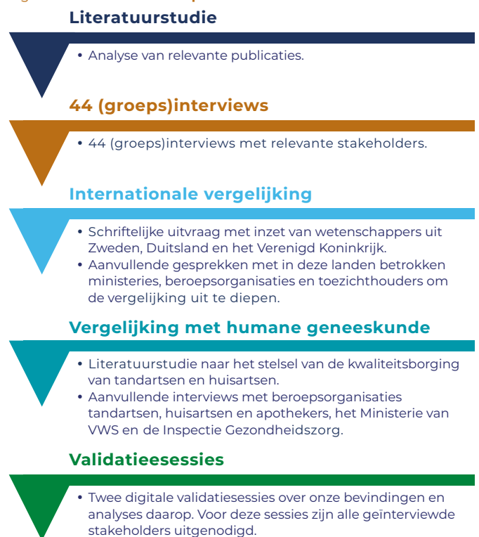
Figuur 1. Onderzoeksaanpak.

Hiernar lichten we kort de verschillende onderdelen van onze onderzoeksaanpak toe. In het algemeen geldt dat wij ons onderzoek conform ons initiële onderzoeksplan hebben kunnen uitvoeren. De enige afwijking heeft zich voorgedaan in relatie tot de te interviewen partijen, dit lichten we verderop toe.