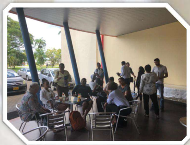
Nabespreking sessie over promoveren, AdeKUS

Tabel 1 geeft de verschillende fasen aan binnen een promotieonderzoek en in welke fase de verschillende geïnteresseerden thans zitten. Ongeveer de helft van de belangstellenden zit in de "voornemensfase" en heeft nog geen onderwerp/onderzoeksvraag maar is wel van plan of heeft interesse om binnen een jaar te starten met een promotietraject. Daarnaast is ongeveer 40% in de verkenningsfase. In deze twee fasen hebben de wetenschappers dus nog geen formele status en ook nog geen uitgewerkt en goedgekeurd onderzoeksvoorstel. Verder is ongeveer 13% reeds gestart en/of heeft al 40-60% van het traject doorlopen.