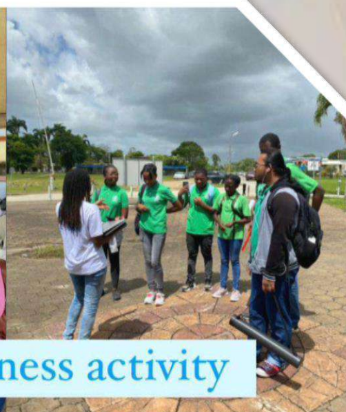
SDG awareness activity