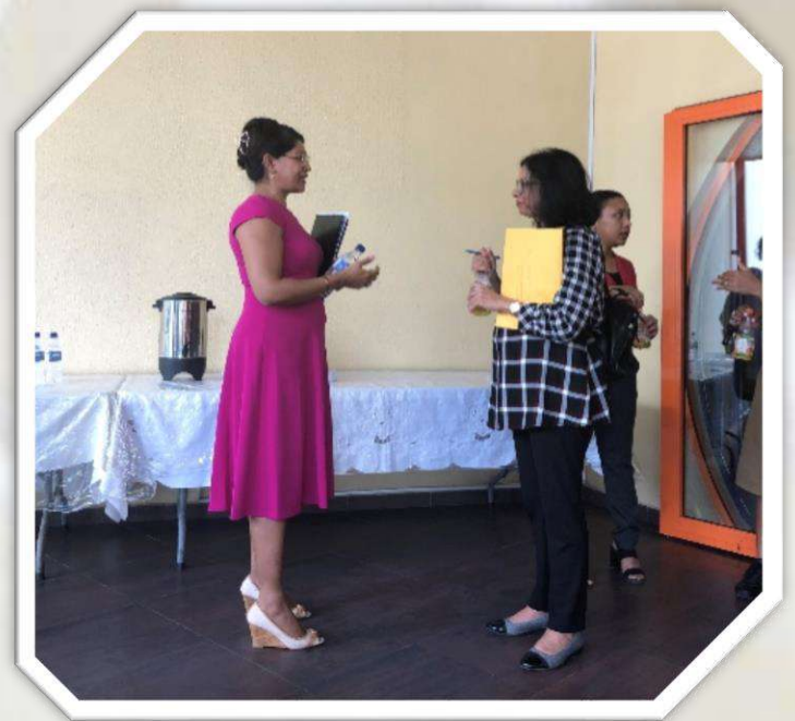
Nabespreking sessie over promoveren, AdeKUS

E. De commissie is ook al begonnen met het koppelen van promovendi aan beschikbare hoogleraren.