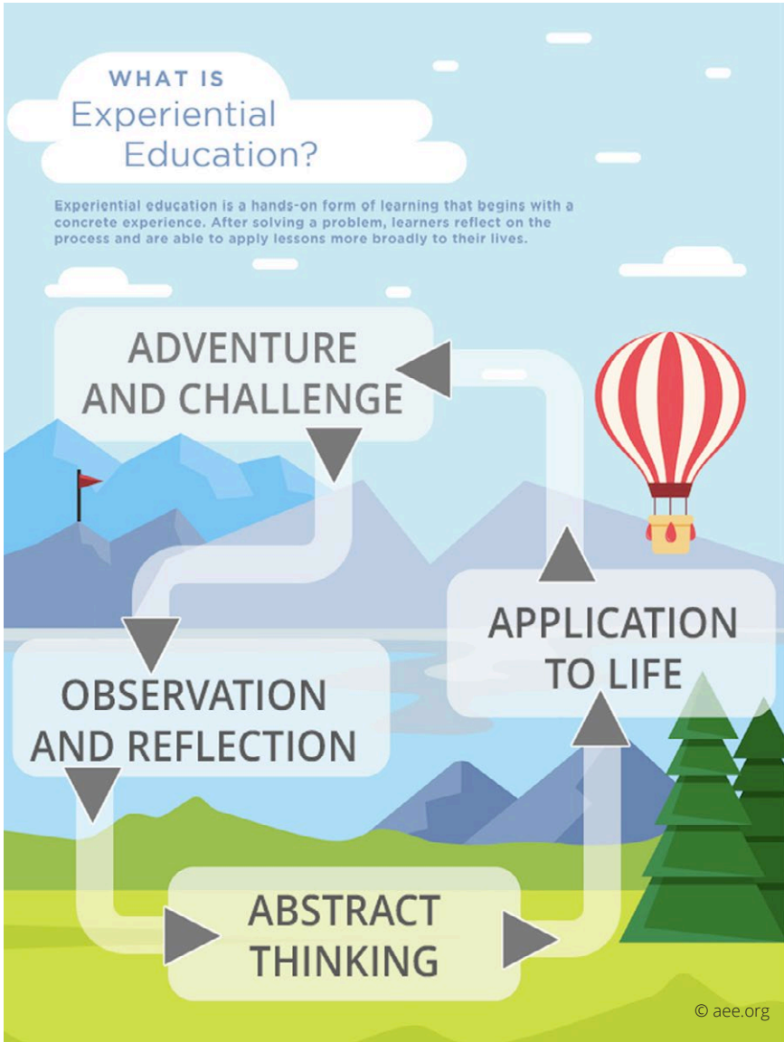
Figuur 3 What is Experiential Education?