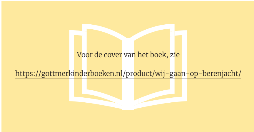
Figuur 1 “Wij gaan op berenjacht”

Text © 1989 Michael Rosen – Illustrations © 1989 Helen Oxenbury From WE'RE GOING ON A BEAR HUNT Written by Michael Rosen & Illustrated by Helen Oxenbury Reproduced by permission of Walker Books Ltd, London, SE11 5HJ www.walker.co.uk