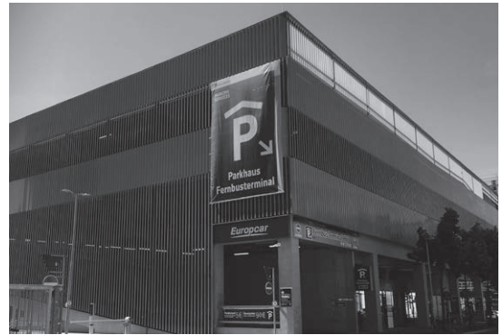
De volgebouwde parkeerplaats bij het centraal station van Leipzig.

Of neem de Sachsenplatz, die nu geen Platz meer is. Begin jaren negentig een kale vlakte in de binnenstad; een plein ontstaan door de bombardementen aan het eind van de Tweede Wereldoorlog. In 2004 kwam daar een kunstmuseum, met een klein grasveldje ervoor, en een muurtje. Handig om op te staan voor een verhaaltje tijdens de rondleiding. Maar dit jaar de brutaliteit: op de plek van 'mijn' muurtje staat een Ibis hotel, alsof het er altijd gestaan heeft! Maar ook een mooie illustratie van de dynamiek die uiteindelijk naar de stad gekomen is. Leipzig is ineens 'hot'. Vandaar de onofficiële slogan: 'Hypezig!'