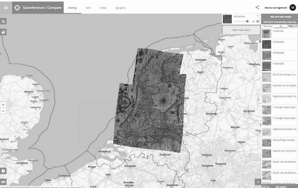
Kaart van Holland uit 1617 door Pieter van den Keere, op de website van Georeferencer Compare.

van de oude cartografische documenten van het Nederlandse grondgebied is een mooi corpus van dit soort bronnen ontsloten. Daarnaast zijn de kaarten georeferereerd, waardoor ze via een geografisch zoekstelsel makkelijk doorzoekbaar zijn. De digitalisering en georeferering vonden in 2017 en 2018 plaats in het kader van het project Zet Nederland op de kaart . Bij georefereren wordt grofweg gesproken een scan van een oude kaart 'geplakt' op een al dan niet moderne digitale referentiekaart. De scan van de oude kaart krijgt dan ruimtelijke informatie mee, waardoor een koppeling met de hedendaagse werkelijkheid mogelijk is. Het proces van georefereren bestaat uit het matchen van controlepunten op een oude kaart met locaties op een referentiekaart. Mits er voldoende controlepunten zijn toegevoegd, kan de oude kaart zo worden ver vormd dat het resultaat zoveel mogelijk de geografische werkelijkheid benadert. De kaart is dan als laag te presenteren in moderne geografische interfaces en informatiesystemen.