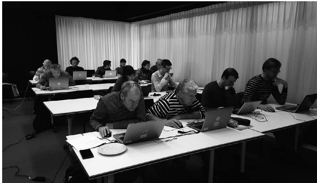
Alumni en donateurs hielpen mee met het georefereren van de oude kaarten.

De Universiteit Utrecht heeft in de loop der tijd een indrukwekkende kaartencollectie weten op te bouwen. Het hoeft geen verwondering te wekken dat een belangrijk deel van de verzameling oude kaarten betrekking heeft op het Nederlandse grondgebied. Dit cartografische materiaal – oorspronkelijk veelal functioneel gebruikt voor bijvoorbeeld planings- en beheersdoeleinden – fungeerde immers later als onderwijs- en onderzoeksobject voor met name Nederlandse