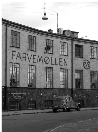
Copenhagen: Buildings in Bispebjerg.

In het zojuist afgeronde Europese project DIVERCITIES hanteren we het begrip hyperdiversiteit, waarmee we benadrukken dat zowel tussen migranten als