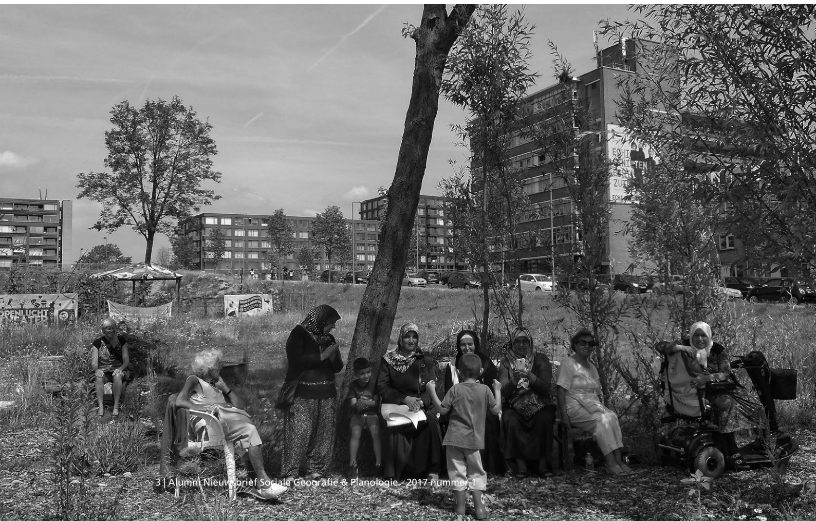
Rotterdam: Neighbourhood garden in Feijenoord.

Uit onze internationale vergelijking valt ten eerste op dat er vaak een spanning bestaat tussen de begrippen erkenning en hervreiding . Een te grote nadruk op erkenning kan het zicht wegnemen op vraagstukken van toenemende ongelijkheid. Londen en Toronto worden vaak geprezen om hun diversiteitsbeleid en tolerantie, maar uit interviews met beleidsmakers uit het veld blijkt dat een dominant positief discours over diversiteit onze blik soms vertroebelt en niet laat zien wat er echt aan de hand is in bepaalde wijken. Diversiteit wordt vooral ingezet als symboolpolitiek, als marketing strategie voor steden, maar er is onvoldoende aandacht voor de problemen en conflicten als gevolg van diversiteit. Bij het bevorderen van