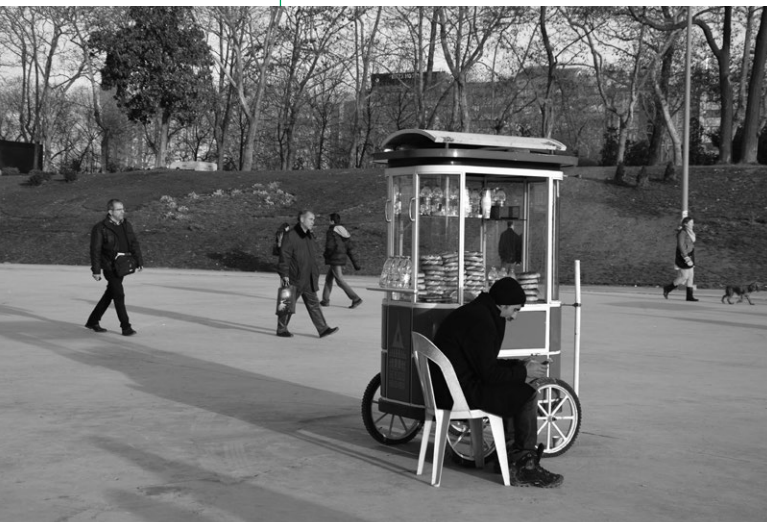
Istanbul: Street vendor at Taksim Square.