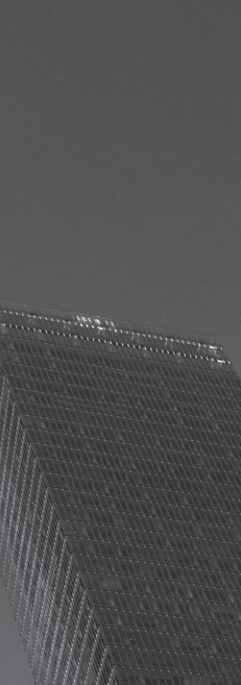
Station - Oculus Calatrava - One World Trade Centre