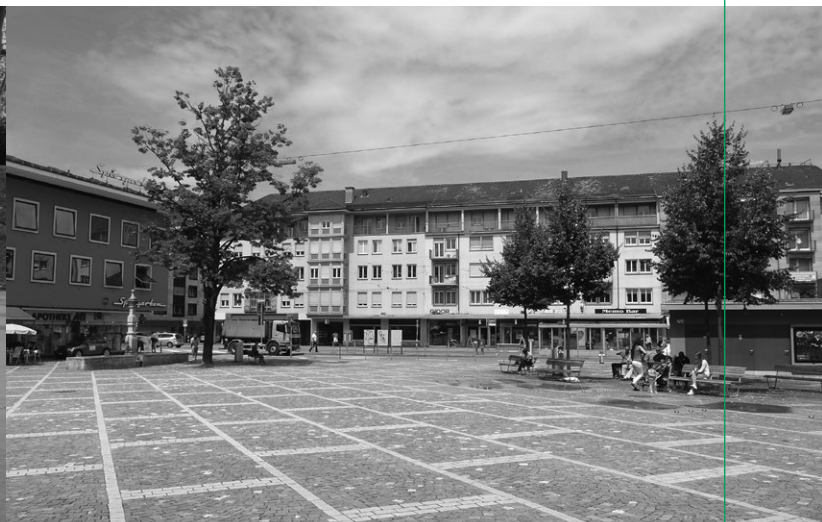
Zurich: Square in District 9.