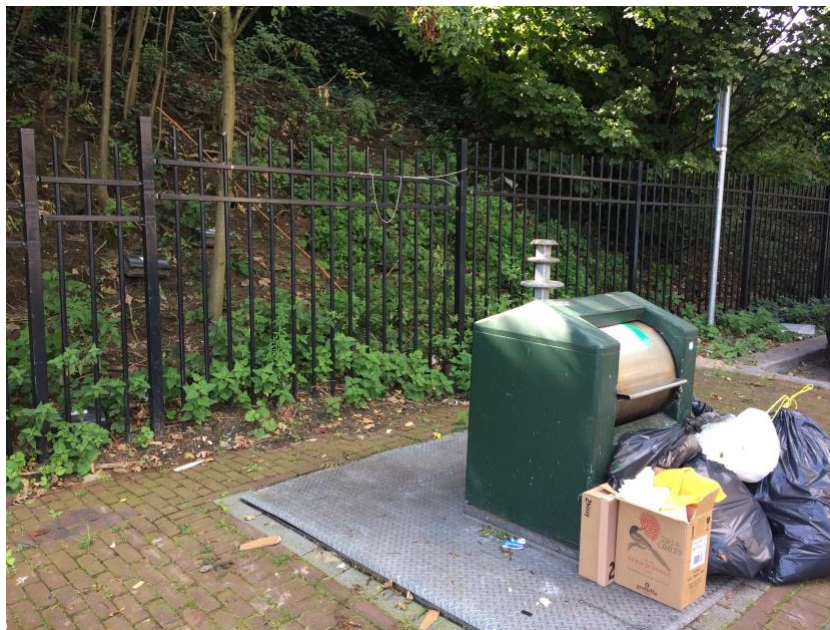
Voorbeeld van hoe gedrag van mensen en afvalbeleid van gemeenten invloed hebben op overlast door ratten en muizen.

Kennis en kunde ontbreekt vaak bij particulieren, maar ook bij professionele opdrachtgevers. Het gaat dan om kennis van ratten en muizen als onderdeel van het ecosysteem waarin wij leven en waarin de dieren bovendien een nuttige rol vervullen. Ze ruimen bijvoorbeeld de omgeving op en houden onze riolen open. Het zijn, eigenlijk net als mensen, dieren die zich uitstekend kunnen aanpassen aan uiteenlopende omstandigheden en elke kans die ze krijgen benutten. Daarnaast zijn veel mensen zich niet bewust van de rol die zij zelf spelen bij het ontstaan van overlast door ratten en muizen. In veel gevallen creëren mensen zelf gunstige omstandigheden voor de dieren, doordat we slordig omgaan met ons afval en voedsel. Door de inrichting van onze leefomgeving en de manier van bouwen bieden we de dieren bovendien tal van schuil- en nestgelegenheden aan. We faciliteren de dieren dus eigenlijk in hun strategie van overleven. Mensen kunnen en moeten zelf meer verantwoordelijkheid nemen in het voorkomen van overlast via betere preventie. Gemeenten kunnen daarin een belangrijke rol spelen middels het voorlichten van particulieren, het verstandig inrichten van gebieden en hun afvalbeleid. We moeten dieren niet straffen voor de fouten die we zelf maken en beseffen dat we ons ecosysteem delen met dieren, waaronder ratten en muizen. Alleen op die manier kan er sprake zijn van een duurzame aanpak van dierplagen.