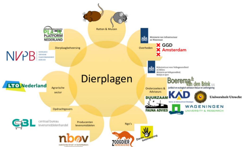
Overzicht van de stakeholders die betrokken waren bij de quick scan over de omgang met ratten en muizen in dierplagen.

Het onderzoek en de brainstorm met stakeholders vormen een eerste inventarisatie en aanzet voor het voeren van een bredere dialoog over de omgang met dieren die mensen als ongewenst beschouwen. Er is een sterkte bereidheid onder stakeholders om gezamenlijk te werken aan het uitwerken van een kader en praktijkgerichte voorstellen voor een verantwoorde en duurzame omgang met plaagdieren. Het negatieve imago dat deze dieren hebben, zou geen reden moeten zijn om dieronvriendelijk met ze om te gaan. Ook zij verdienen een verantwoorde behandeling. CenSAS gaat hier, samen met stakeholders, verder mee aan de slag.